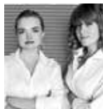
URSZULA SZMYT ALEKSANDRA KOŁODZIEJ Pracownia Kołodziej & Szmyt kolodziejszmyt.com