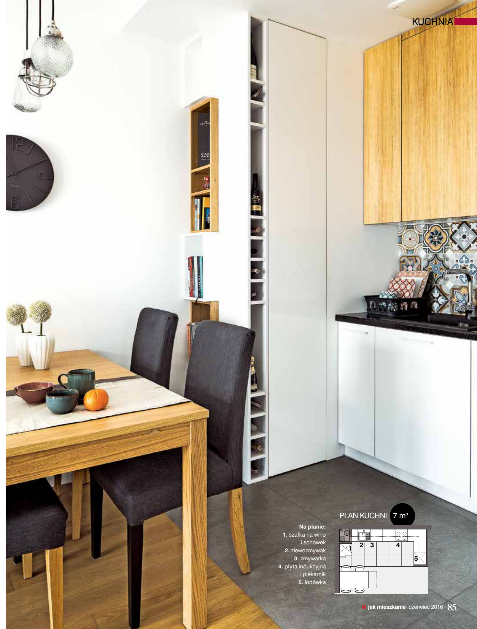
PLAN KUCHNI 7 m 2

Wybór najważniejszego i najbardziej wyrazistego elementu dekoracji kuchni był dla właścicieli oczywisty. – Od dawna wiedzieliśmy, że w nowym mieszkaniu muszą pojawić się wzorzyste kafle, które często podziwialiśmy, odwiedzając Barcelonę. Wymarzony wzór znaleźliśmy w... Polsce, w naszej ulubionej knajpce z tapasami. ●